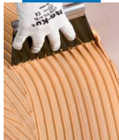
Ottima tenuta della riga e lavorabilità

Le referenze relative a questo prodotto sono disponibili su richiesta e sul sito www.mapei.it e www.mapei.com