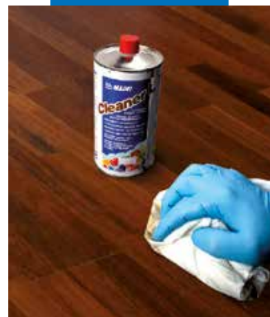
Pulizia di parquet prefinito di grande formato con Cleaner L